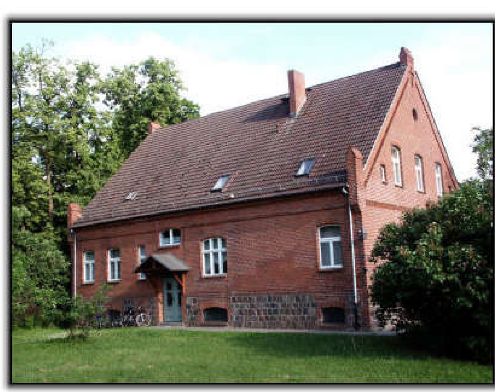
Ev. Gemeindehaus Britzer Straße 2

Die Bücherstube gibt es seit September 2005 und wurde zu den wöchentlichen Öffnungszeiten von Lesern aller Altersgruppen dank eines stattlichen Bestandes von mehr als 4.000 Medien rege genutzt. Seit etwa 3 Jahren (Sommer 2017) erfolgte die Ausleihe nur noch auf Anforderung – regelmäßige Öffnungszeiten gab es nicht mehr. Doch jetzt gibt es: