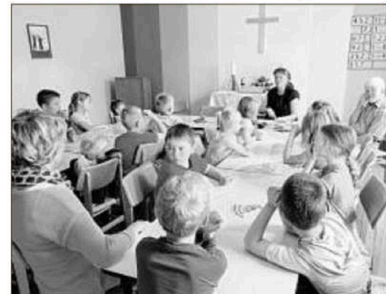
Hören zu: Die Erstklässler lauschen andächtig bei der Vorlesestunde in der Lichterfelder Bücherstube.

Auf dem Programm stand „Ida, Paul und die fiesen Riesen aus der Dritten“